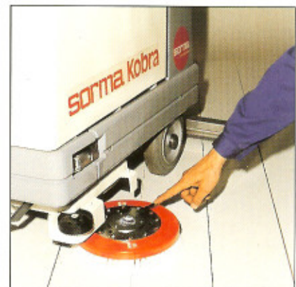
Die Bürsten sind ohne Werkzeug mühelos und schnell zu wechseln.