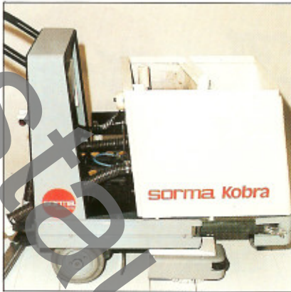
Die Batterien sind durch Wegfahren der Tankeinheit gut zugänglich.