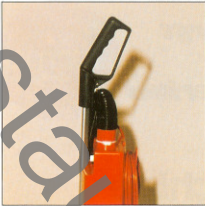
Der ergonomisch geformte Griff aus elastischem und bruchfestem Kunststoff