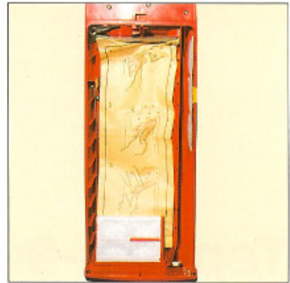
Der Papierfilterbeutel wird von oben gefüllt und deshalb maximal ausgenutzt.