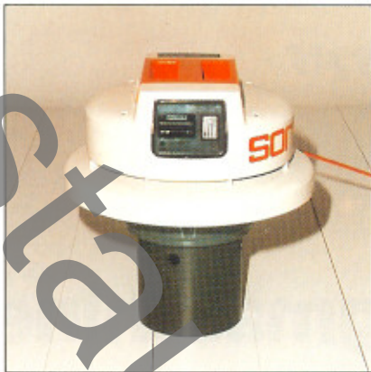
In Sonderausführung der sorma Saugkopf mit mechanischem Schwimmer.