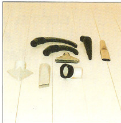
Zur Maschine ist umfangreiches Saugzubehör lieferbar.