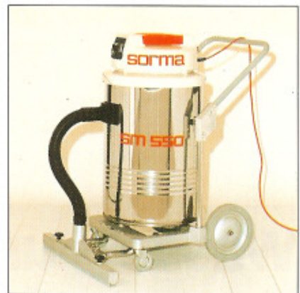
Die sorma sm 550 mit starrer Saugvorrichtung.