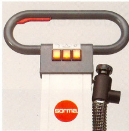
Alles im Griff, für leichtes Handling!