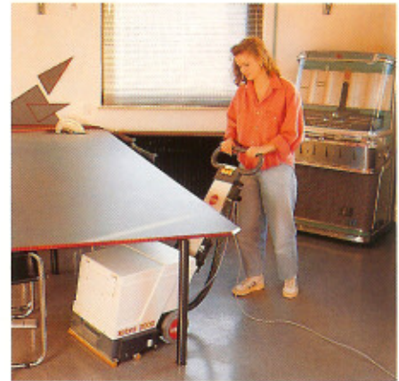
Überstellte Flächen in engen Räumen reinigen!