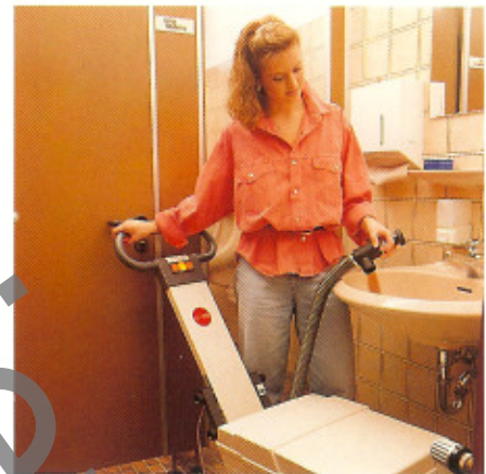
Das Schmutzwasser bequem abpumpen!