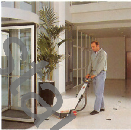
In Foyers den Schmutz rasch beseitigen!