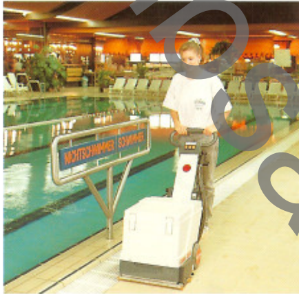
Hygienisch, gründlich, randnah arbeiten!